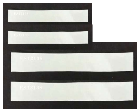
番号付き透明封印シール付属