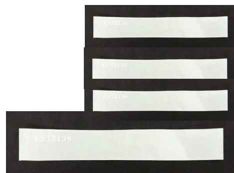
改ざん防止 番号付き透明封印シール 4枚付属