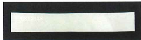
ナンバリング透明封印シール付属 ※改ざん防止用特殊印刷